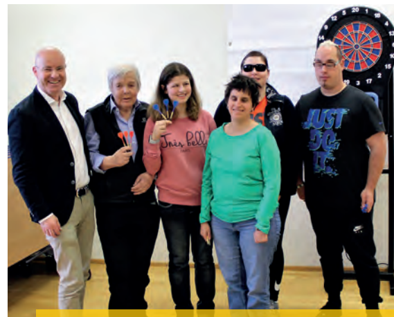
Große Freude mit dem Darts-Automat mit Sprachausgabe

Das barrierefreie Gästehaus Stubenberg am See bietet sich aufgrund seiner Infrastruktur dazu sehr gut an. Hier können die Gäste in Gehdistanz zum See