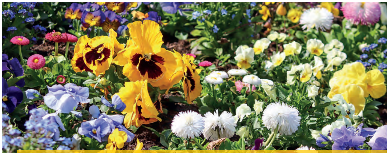
Blühendes Beet – ein bunter Garten erfreut alle Sinne.

Die Kultur und Freizeit für unsere Mitglieder lag uns aber genauso am Herzen. Neben einer Faschingsfeier, einem Sommerfest, einer Weihnachtsfeier und einem Kegeltouren machten wir einen Ausflug nach München in die Bavaria Filmstudios, besuchten ein Konzert von Hansi Hinterseer und