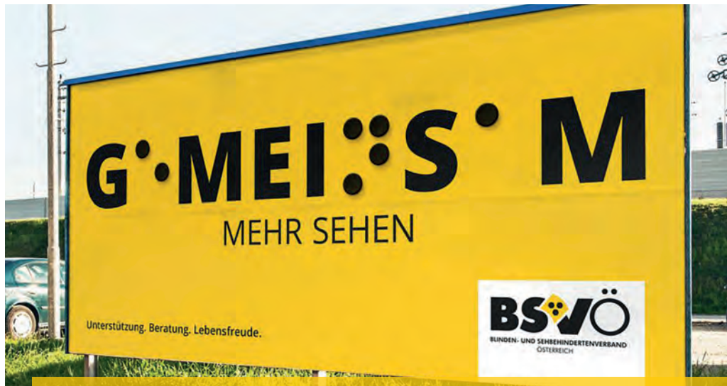
Das Dachmarkensujet in eindrucksvoller Größe auf einer Plakatwand.

In einer österreichweiten Plakatkampagne wurde das Motto des BSVÖ „Gemeinsam mehr sehen“, prominent und spannend kommuniziert: Das Plakat spielte mit der Verbindung von Braille-Punkten und Buchstaben und rückte mit der Botschaft: „Unterstützung. Beratung. Lebensfreude“ auch die Kernaufgaben des Verbandes in den Fokus. Plakate und Citylights führten schon im ersten Durchlauf zu einer Steigerung des Bekanntheitsgrades des BSVÖ.