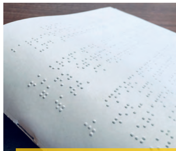
Ein aufgeschlagener Braille-Druckbogen

Im Brailleschriftkomitee der deutschsprachigen Länder, dem übergeordneten Gremium hat es im November 2018 ein Treffen gegeben. Die Veröffentlichung der neuen Systematik der Brailleschrift, die wenige Reformen enthält, wurde im August 2018 abgeschlossen. Die Hersteller von Übersetzungssoftware haben die geringfügigen Umstellungen bereits eingearbeitet. Die Geschäftsordnung steht knapp vor ihrer Verabschiedung. Die Angleichung des Lautschriftsystems des anglo-amerikanischen Raumes an die Brailleschrift im deutschsprachigen Raum ist weiterhin in Arbeit. Die neuen Mitglieder des Komitees bringen hierbei viel Erfahrung