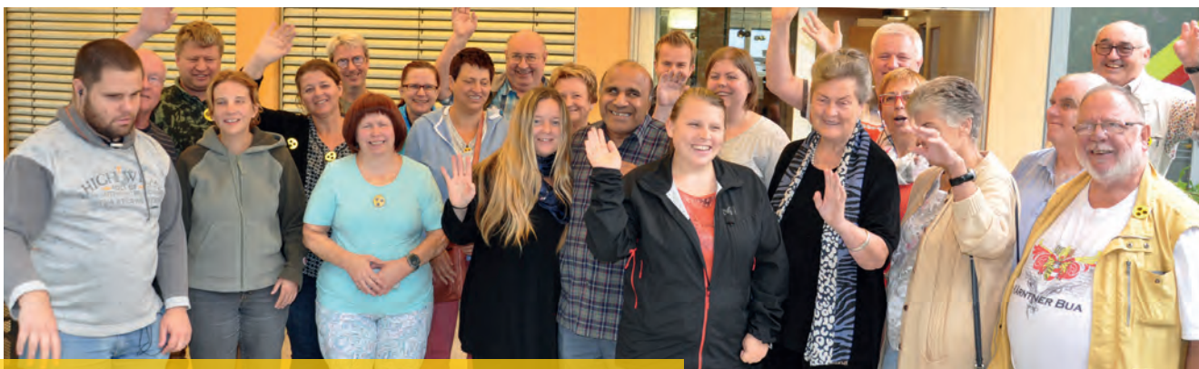
Eine fröhliche Runde mit Besuchern aus ganz Österreich beim Generationentreffen in Klagenfurt im Juli 2018.

Außerdem lud der BSVK erstmals eine Sexualpädagogin vom Verein „liebenslust“ aus Graz ein, um über Gefühle, Kennenlernen und Sexualität in einem ausgebuchten Workshop zu sprechen. 2018 hat wahrlich frischen Wind in den BSVK gebracht!