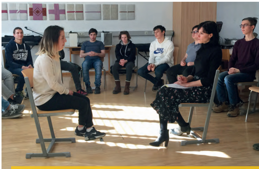
Teilnehmer_innen beim Bewerbungstraining für Jugendliche und junge Erwachsene mit Sehbehinderung

Erstmals seit Bestehen des Blinden- und Sehbehindertenverbandes Österreich wird die Thematik der Geschlechtergerechtigkeit ins Zentrum seiner Projektarbeit gerückt. Das Projekt GEAR (Gender Equality Awareness Raising) steht für Bewusstseinsbildung im Bereich der Geschlechtergerechtigkeit und ist ein Projekt der Europäischen Blindenunion, das der BSVÖ gemeinsam mit dem Schwedischen Blindenverband seit Ende letzten Jahres leitet. Den Auftakt machte ein zweitägiges Training unter der Leitung von