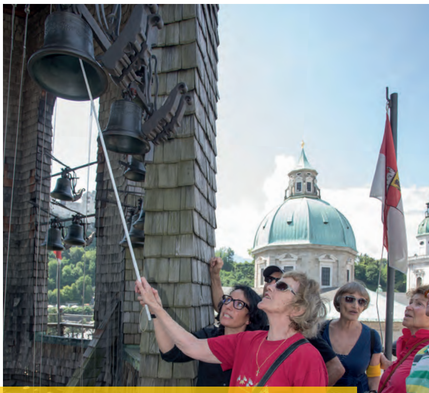
Erfolgreiche Öffentlichkeitsarbeit: BSVS-Mitglieder mit Medienbegleitung am Salzburger Glockenspiel.

Wir gehen den Weg, den wir eingeschlagen haben, voran. Wir wollen unser Angebot weiter ausbauen und professionalisieren: Ich bin überzeugt, dass wir hier mit unserer neuen Ansprechpartnerin für sozialrechtliche Fragen bestens aufgestellt sind.