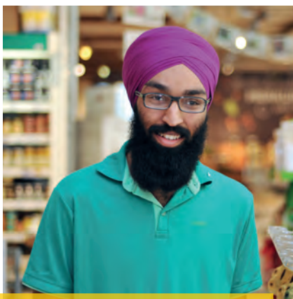
SEBUS-Praktikum: Regalbetreuung bei Merkur

Die Angebotsflut hat auch ihr Gutes – Sie haben die Wahl. Lassen Sie sich nichts einreden, treffen Sie Ihre Entscheidung selbst – es ist Ihr Leben!