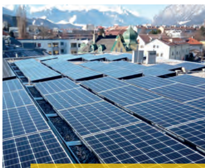
Photovoltaikanlage am Dach des BSZ Tirol.

Der Vorstand des BSVT hat beschlossen, am Dach des Blinden- und Sehbehindertenzentrums